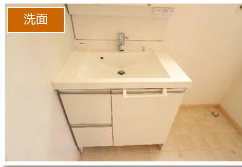
洗面 洗面化粧台もすっきりと シンプルでオシャレなデザイン