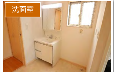
洗面室 廊下からもキッチンからも 引き戸で出入りできます