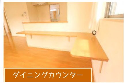
ダイニングカウンター