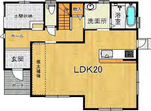
ゆったり広く明るいリビング