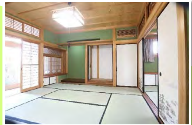
和室② 贅沢な床の間・仏間・雪見障子・欄間・書院造りは必見