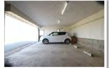
ガレージ 電動シャッター付きで大切な愛車を守ります

土地 336.29㎡ (101.72坪) 建物 254.19㎡ (76.89坪)